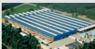
Hörmann Genk NV, België