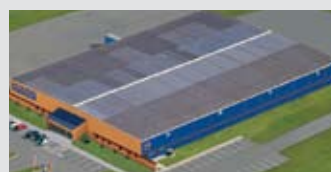
Hörmann Gadco LLC, Vonore TN, USA

De Hörmann-groep biedt, als enige fabrikant op de internationale markt, alle belangrijke bouwelementen uit één hand. Zij worden in hooggespecialiseerde fabrieken vervaardigd volgens de nieuwste stand van de techniek. Door het overkoepelende verkoops- en servicenet in Europa en de aanwezigheid in Amerika en China is Hörmann uw sterke internationale partner voor hoogwaardige bouwelementen. In een kwaliteit zonder compromissen.