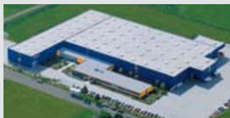
Hörmann KG Dissen