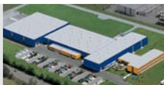
Hörmann KG Antriebstechnik