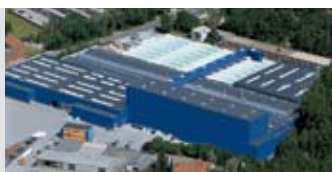
Hörmann KG Amshausen