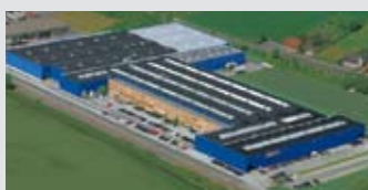
Hörmann KG Werne