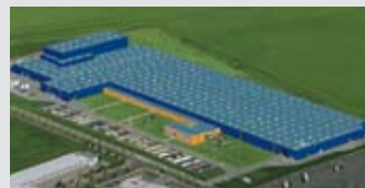
Hörmann KG Ichtershhausen