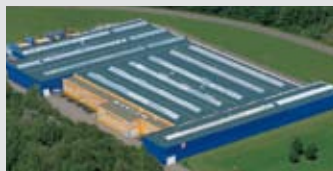
Hörmann KG Eckelhausen