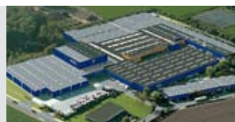
Hörmann KG Brockhagen