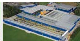
Hörmann KG Brockhagen, Duitsland