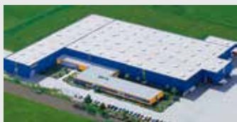
Hörmann KG Dissen, Duitsland