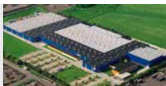
Hörmann KG Brandis, Duitsland