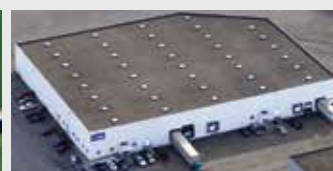
Hörmann Flexon, Leetsdale PA, USA

De Hörmann-groep biedt, als enige fabrikant op de internationale markt, alle belangrijke bouwelementen uit één hand. Ze worden in hooggespecialiseerde fabrieken vervaardigd volgens de nieuwste stand van de techniek. Door het overkoepelende verkoops- en servicenet in Europa en de aanwezigheid in Amerika en China is Hörmann uw sterke internationale partner voor hoogwaardige bouwelementen. In een kwaliteit zonder compromissen.