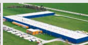
Hörmann Legnica Sp. z o.o., Polen