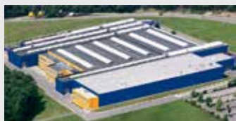
Hörmann KG Eckelhausen, Duitsland