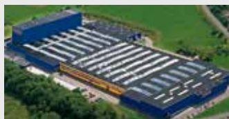
Hörmann KG Freisen, Duitsland