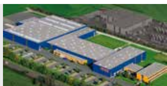
Hörmann KG Antriebstechnik, Duitsland