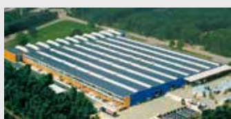
Hörmann Genk NV, België