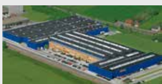
Hörmann KG Werne, Duitsland