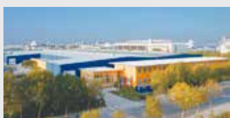
Hörmann Beijing, China