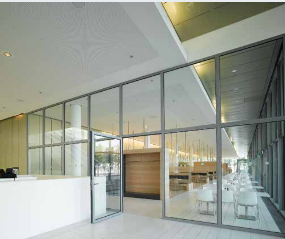
Brandwerende en rookdichte afsluitingen