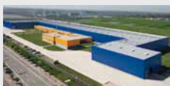
Hörmann Tianjin, China