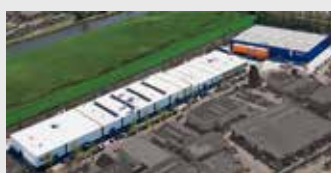
Hörmann Alkmaar B.V., Nederland