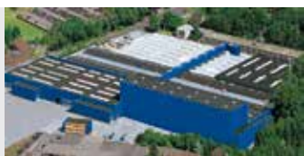
Hörmann KG Amshausen, Duitsland