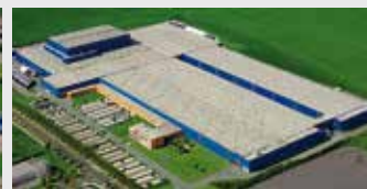
Hörmann KG Ichtershausen, Duitsland