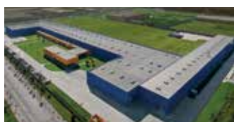
Hörmann Tianjin, China