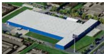
Hörmann KG Dissen, Duitsland