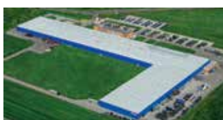
Hörmann Legnica Sp. z o.o., Polen