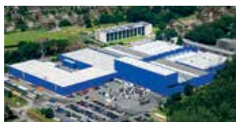
Hörmann KG Amshausen, Duitsland