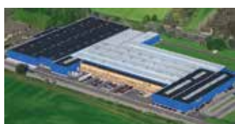
Hörmann KG Werne, Duitsland