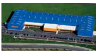
Hörmann Flexon LLC, Burgettstown PA, USA