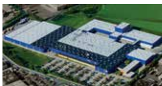
Hörmann KG Brandis, Duitsland