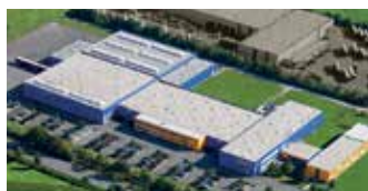
Hörmann KG Antriebstechnik, Duitsland