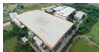
Shakti Hörmann Pvt. Ltd., India

De Hörmann-groep biedt, als enige fabrikant op de internationale markt, alle belangrijke bouwelementen uit één hand. Ze worden in hooggespecialiseerde fabrieken vervaardigd volgens de nieuwste stand van de techniek. Door het overkoepelende verkoop- en servicenet in Europa en de aanwezigheid in Amerika en Azië is Hörmann uw sterke internationale partner voor hoogwaardige bouwelementen. In een kwaliteit zonder compromissen.