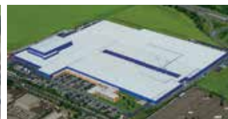
Hörmann KG Ichtershausen, Duitsland