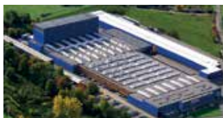
Hörmann KG Freisen, Duitsland