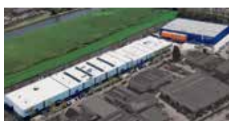
Hörmann Alkmaar B.V., Nederland