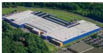
Hörmann KG Eckelhausen, Duitsland