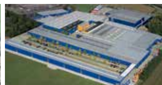
Hörmann KG Brockhagen, Duitsland