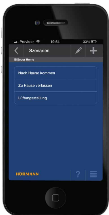
Foto 4: Voor terugkerende situaties kan in de app een zogenoemd scenario worden ingesteld. Daarmee is het mogelijk in één beweging verschillende acties uit te voeren, zoals het openen van een inrithek en een garagedeur bij het dagelijkse thuiskomen.