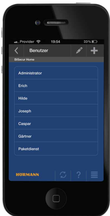
Foto 5: In de Hörmann-app kunnen in totaal tot tien gebruikers met verschillende rechten worden geregistreerd. Zo kan bijvoorbeeld de buurman wel het inrithek openen om de bloemen water te geven, maar heeft hij geen toegang tot de garage.