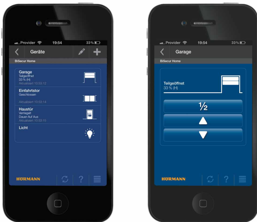
Foto 3: In de Hörmann BiSecur-app wordt via symbolen behalve de positie van de geregistreerde poorten en deuren ook die van de verlichting weergegeven.