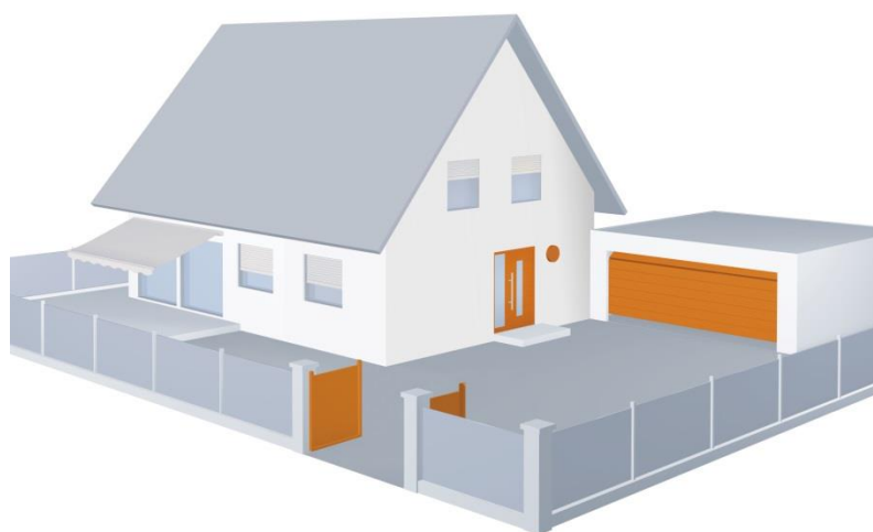
Foto 5: De Hörmann PortaMatic-deuraandrijving kan worden bediend met de door Hörmann ontwikkelde BiSecur-radiotechniek, waarvan ook gebruik wordt gemaakt voor het openen van de voordeur, de garagedeur en het inrithek evenals andere elektrische apparaten of verlichting. Zo kunnen deze allemaal via één enkele handzender, muurschakelaar of de Hörmann BiSecur APP voor smartphones en tablets worden bediend.

Foto 4: De PortaMatic-deuraandrijving van Hörmann is ook geschikt als comfortabele oplossing in moderne eigen woningen. Met zware boodschappentassen of een dienblad in de handen maken automatisch bediende deuren het dagelijks leven een stuk gemakkelijker.