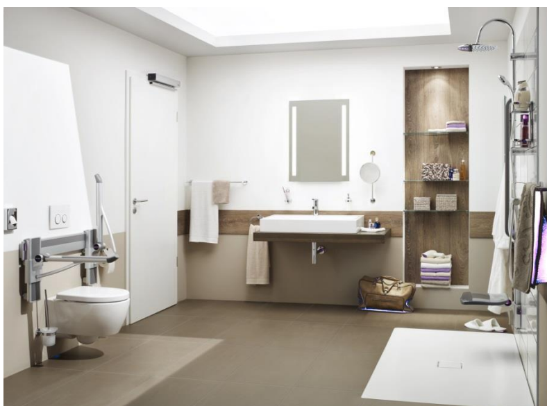
Foto 3: Tot een barrièrevrije badkamer behoort niet alleen een gelijkvloerse douche en een aangepaste wc, maar ook een met behulp van de PortaMatic-aandrijving automatisch bediende deur, waardoor rolstoelgebruikers of mensen met een rollator gemakkelijk toegang tot de badkamer hebben.

Foto 2: De binnendeuraandrijving PortaMatic van Hörmann is al naargelang deurmaat geschikt voor houten en stalen deuren en kan worden bediend via een muurschakelaar, handzender of de Hörmann BiSecur APP. Wanneer men daarvoor een aanvraag indient, is zelfs een vergoeding tot wel 100% door de zorgverzekering mogelijk.